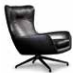
3-4 JENSEN BERGÈRE CM 81X97 H94 POUF CM 62X66 H40